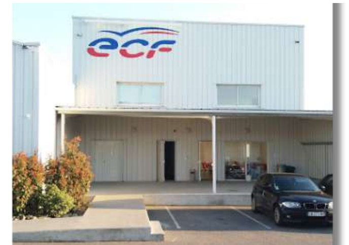
📍 W.C 📍 Cafétéria 📍 Salle 6 - 7 - 8