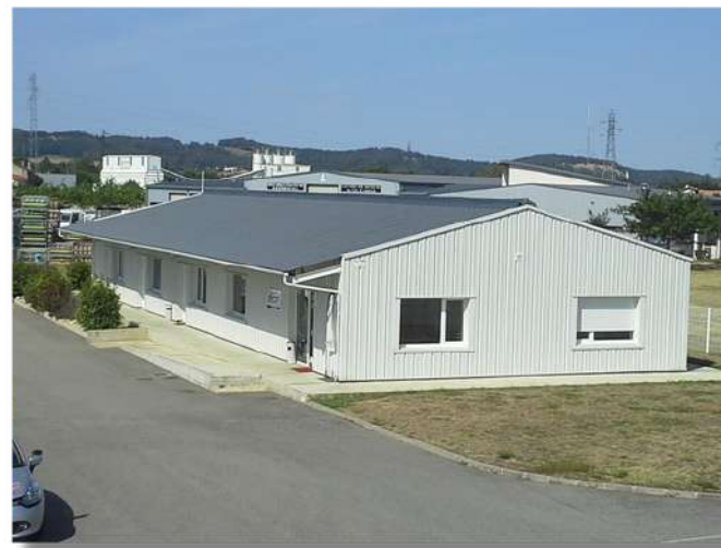
📍 Salle 1 - 2 - 3