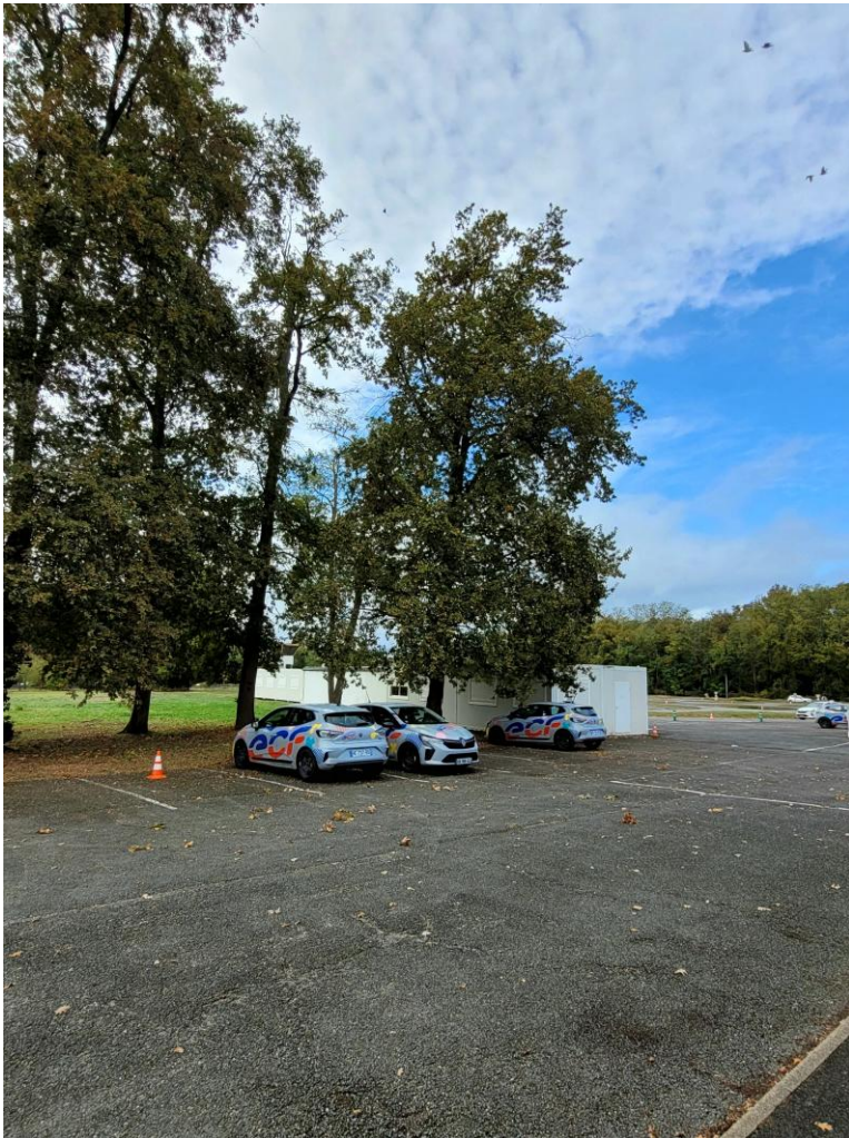
Vue extérieure à l'arrière du bâtiment