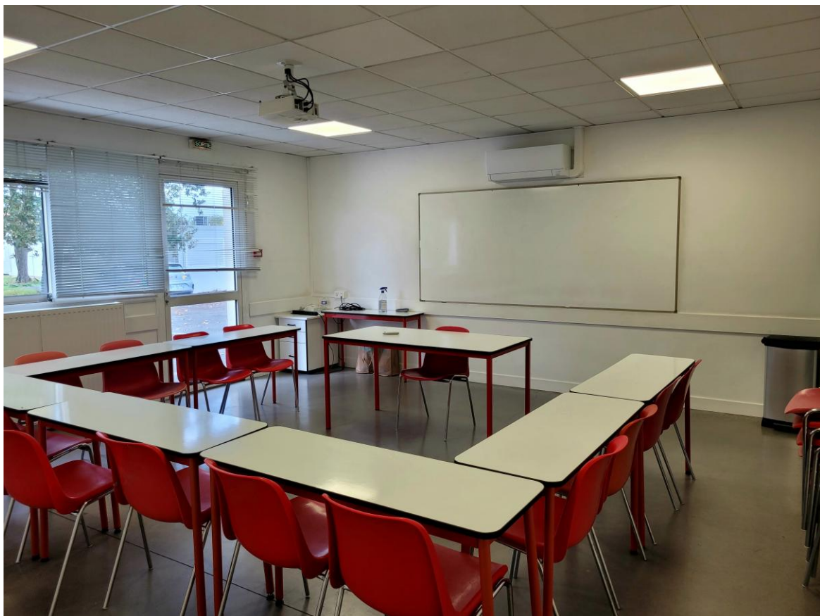
Salle de cours N°2