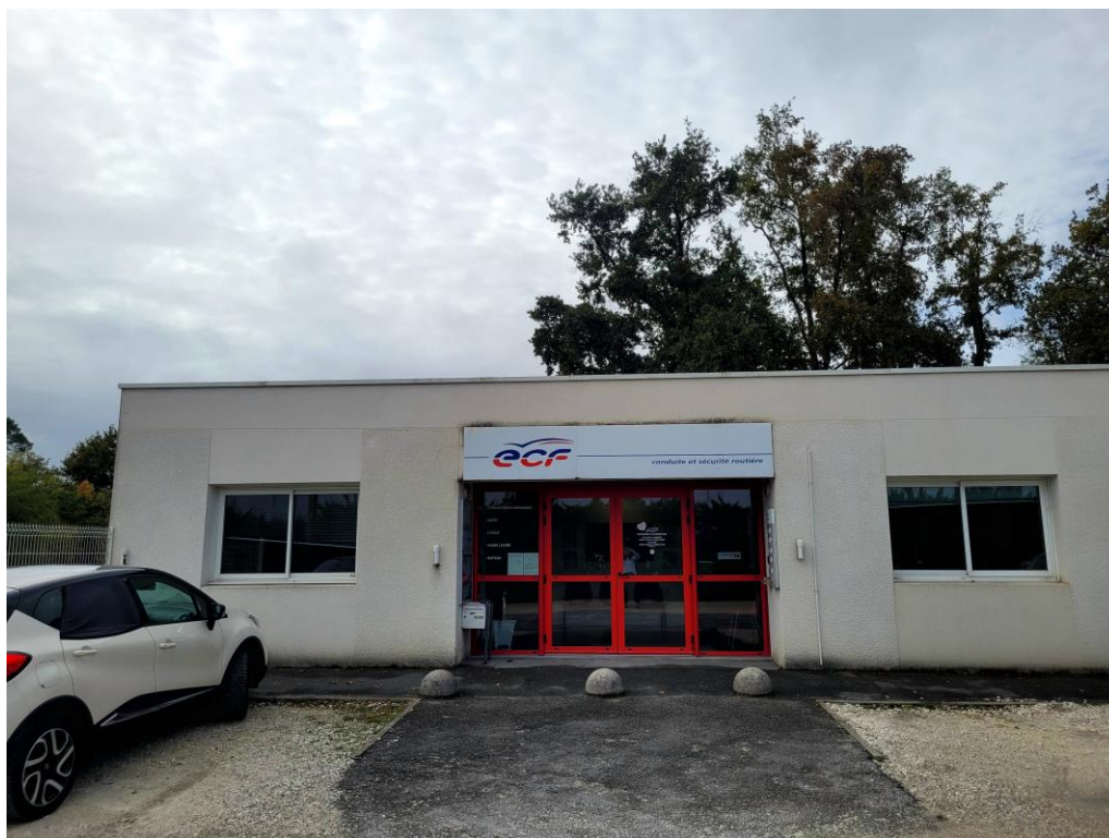
Vue extérieure rue du Pinsan

1 personne en charge des relations avec les personnes en situation de handicap dans notre agence : Eva MENOT