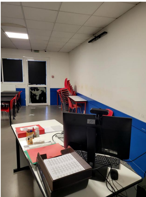
Salle de cours N°1